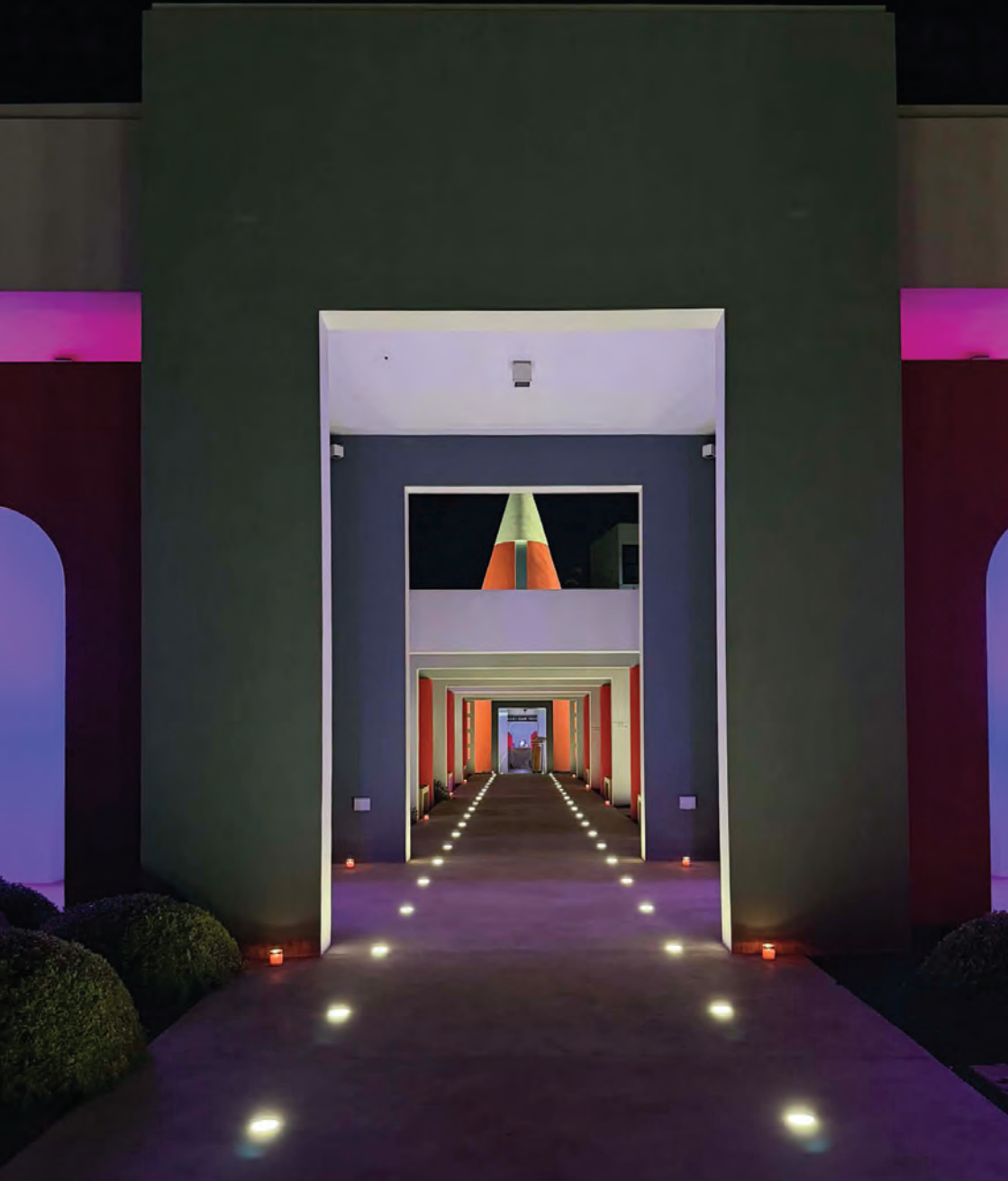
Ġnien il-Meditazzjoni f'Dar il-Hanin Samaritan (2024), Richard England, Santa Venera