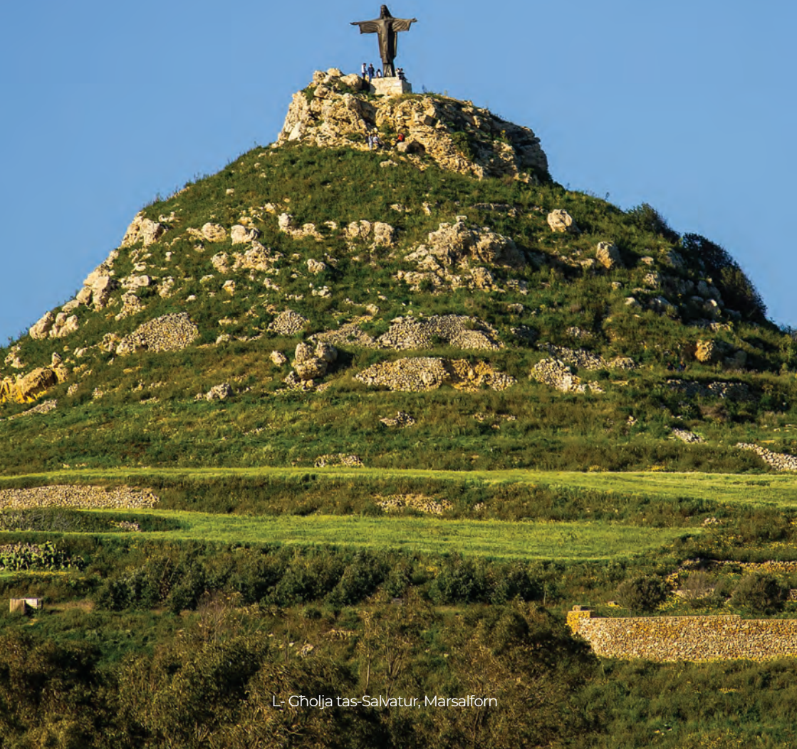
L- Cholja tas-Salvatur, Marsalforn