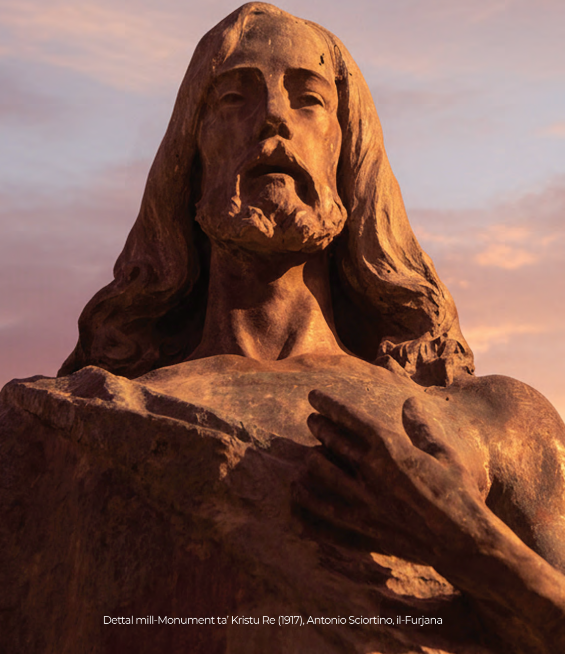
Dettal mill-Monument ta' Kristu Re (1917), Antonio Sciortino, il-Furjana